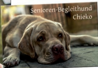
Seniorenhilfe Dorsten Beate Gerle-Bönte